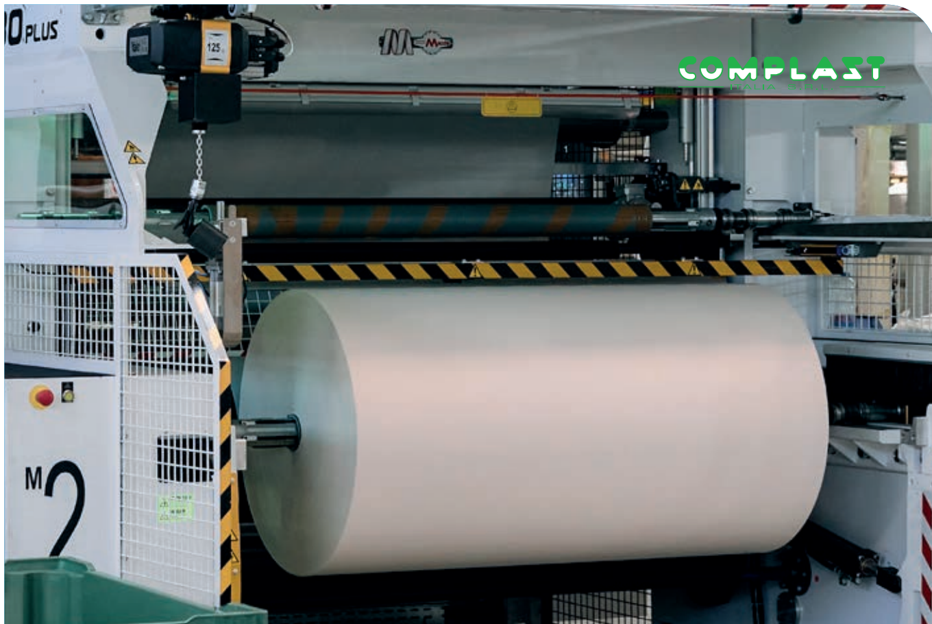
Semilavorati bobine in PE HD/LD/Biocompostabile

Complast dispone di otto linee di estrusione Hosokawa Alpine e Macchi, tutte di ultima generazione, di cui quattro coestrusi. Questi impianti possono produrre bobine in PE HD/LD e Biocompostabile.